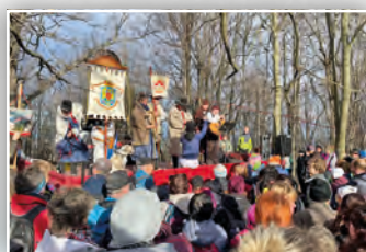
◀ MONTE ČUPELO ▶