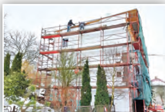
▶ REKONSTRUKCE HASIČSKÉ GARÁŽE ◀