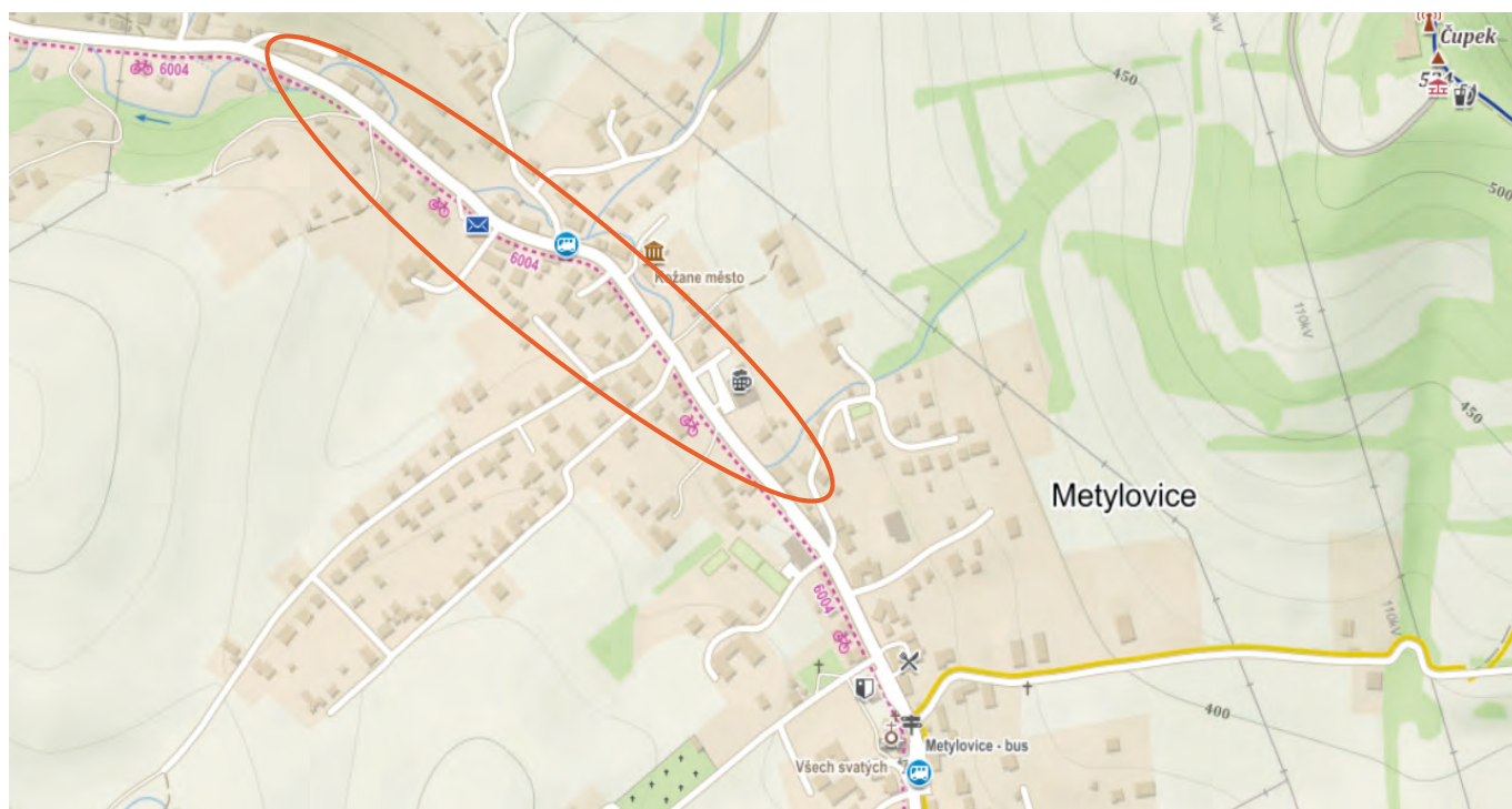
Obr. 1 - Pravděpodobné místo prvního osídlení Metylovic

Jak tehdejší Metylovice mohly vypadat? Základem byla voda. Proto se první obyvatelé Metylovic usadili podél potoka Metylovka.