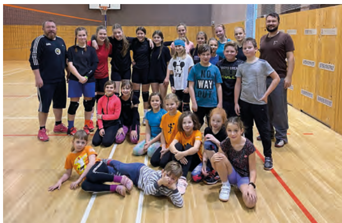
Vánoční turnaj – mládež