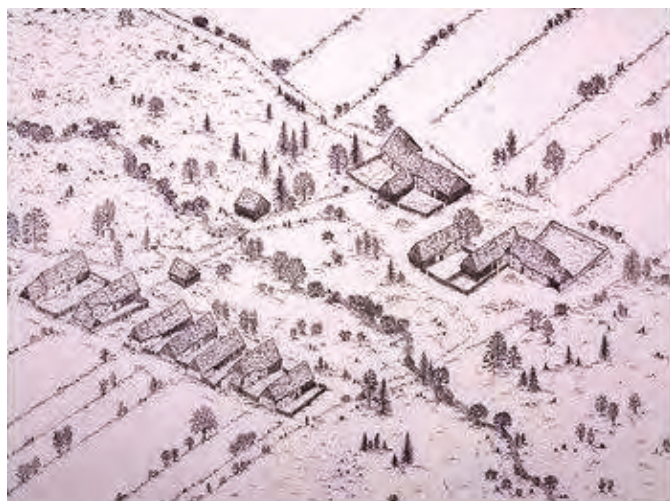
Obr. 2 - Obvyklý půdorys vesnice vzniklé kolonizací ve 13. století

V předchozích stoletích byl systém trochu jiný. Vesničané mohli nakládat s půdou v rámci své vesnice do jisté míry svobodně. Své pole nemuseli mít u domu, ale mohli si ho zřídit v rámci své vesnice kdekoliv. Vzhledem k tomu, že ale docházelo ke sporům, systém rozdělení půdy se sjednotil.