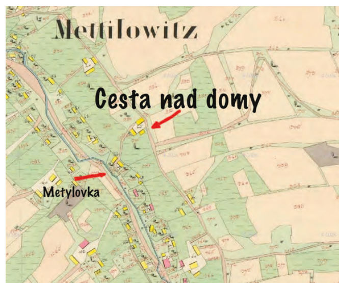
Obr. 3 - Mapa ze začátku 19. století zobrazuje možná původní metylovskou hlavní cestu