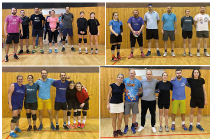
Vánoční turnaj – dospělí

Odpoledne už patřilo dospělým, i když se ho zúčastnily i některé nejstarší a nejdůležitější juniorky z dopolední části. Do turnaje se přihlásilo celkem 24 účastníků, a to v genderově vyváženém poměru 12 žen/12 mužů. Losem byly vytvořeny 4 družstva ve vyváženém mixu žen a mužů a mohly začít boje. Každé družstvo odehrálo 3 zápasy na 2 hrané sety, takže sportu bylo dost, pro některé