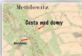
▶ HISTORIE METYLOVIC - 1. ČÁST ◀