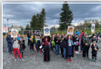
JARNÍ SLAVNOSTI ČAR A KOUZEL