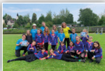
BRONZOVÉ MEDAILE MLADÝCH HASIČŮ