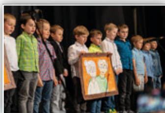
DEN RODIN - VYSTOUPENÍ ŽÁKŮ ZŠ A MŠ