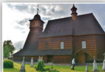
STÁVAL DŘÍVE HRABOVSKÝ KOSTEL V METYLOVICÍCH?