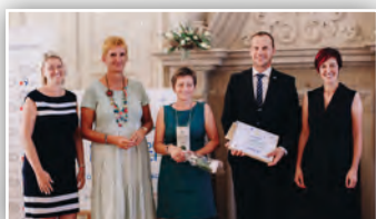
▶ 3. MÍSTO NAŠÍ OBCE V SOUTĚŽI „O KERAMICKOU POPELNICI“ ◀