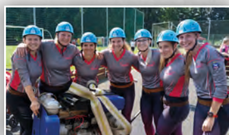
▶ HASIČKY Z METYLOVIC – mistryně Moravskoslezské ligy ◀