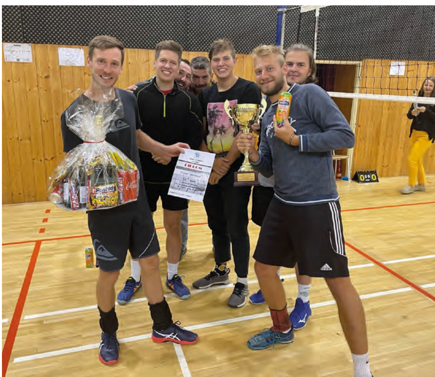
Vítěz turnaje TJ Sokol Palkovice