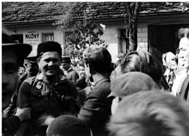
Radostné vítání prvních ruských vojáků na Dolním konci