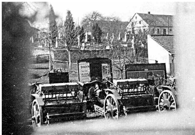
Pohled přes okno na německé děla před Obecním hostincem