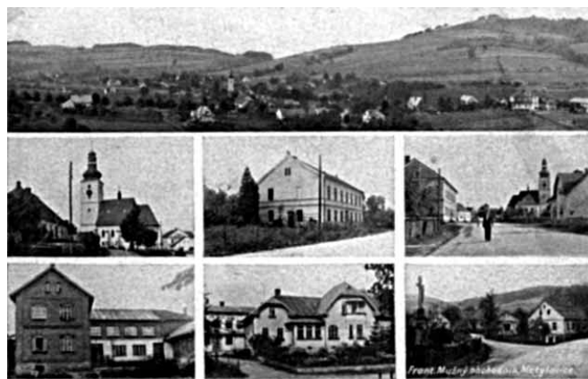
Metulovice před válkou

1. září 1939 byla fingovaným útokem na německý vysílač ve slezské Gliwici zahájena