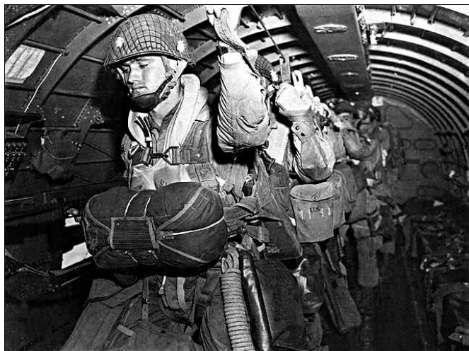
Čekání na seskok — ilustrační foto

Dopad kouřícího letadla, vydávající hrozivý zvuk, viděli v poledních hodinách i někteří metylovští občané, kteří se u hořícího trupu střetli s příjízdnými Němci, pátrajícími po parašutistech. Naši občané na nic nečekali a rozprchli se tak rychle, až pozráceli konzervy, které si chtěli vzít.