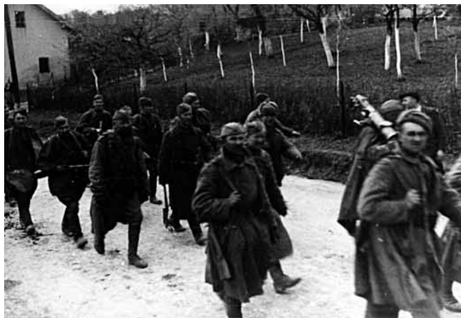
Ruské vojsko procházející vesnici těsně po osvobození

Když se skoro do osmi hodin na vesnici nic neděje, jdu jako obvykle do obecní kanceláře. Na vesnici je prázdná. Jen tu a tam se mezi dveřmi někdo mihne. Na cestě se objevují dvě ženské, ukazují si vzrušeně na Čupek. Pohlédnu tím směrem a hle! Z budovy vlaje rudý prapor. Ženské se objímají, pláčou. I já cítím pohnutí. Jdu dál. Přicházím k obecnímu hostinci. Proti mně jde od kostela ruský voják se samopalem na krku, z každé strany má dva mladé civilisty, z nichž jeden rovněž nese pušku. Voják si jde docela bezstarostně. Přitom je v docela neznámém prostředí a nemůže vědět, kde číhá puška nepřitele. Vždyť i já jsem byl voják a vím, že v tomto případě je třeba postupovat zcela opatrně.