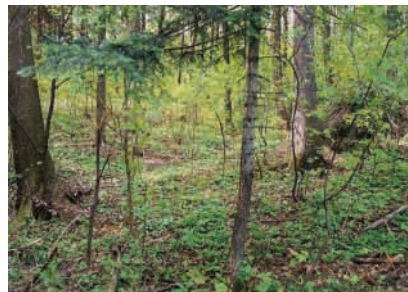
Jen malá prohlubeň připomíná místo dopadu