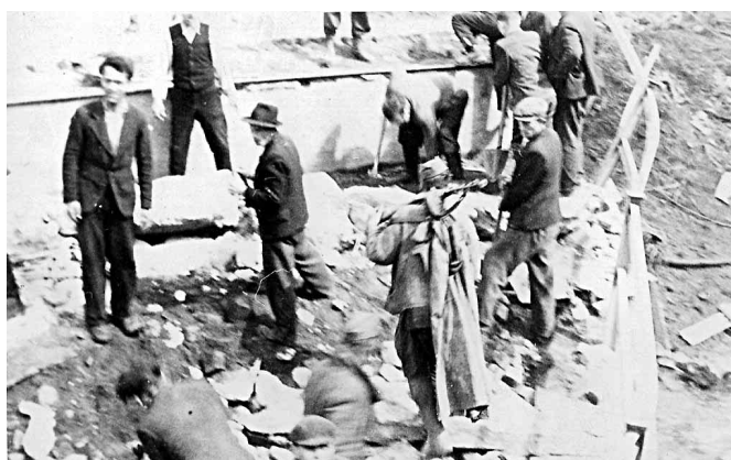
Práce na stavbě provizorního mostu na Dolním konci