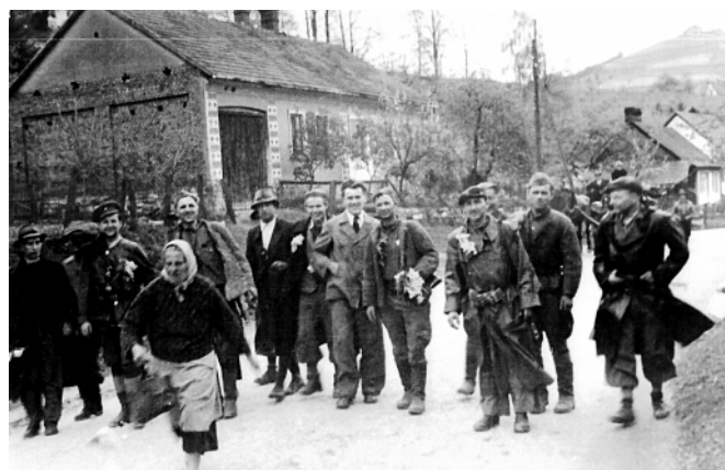
Foto na památku z osvobození.