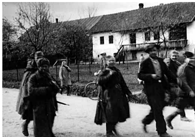
Vojáci při pochodu vesnici