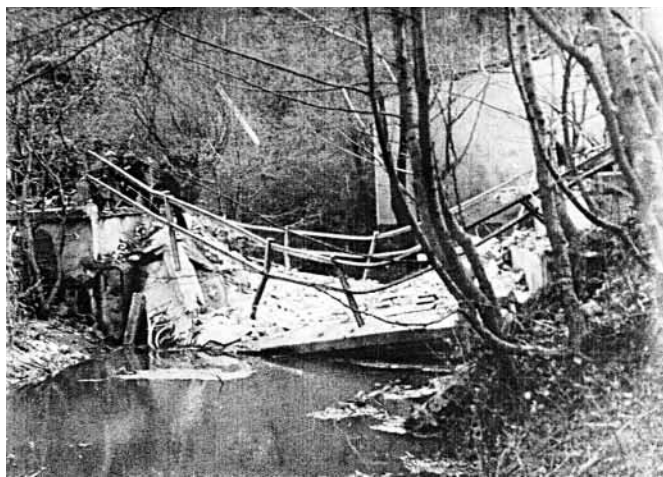
Vyhozený most přes Olešnou na Dolním konci 5. 5. 1945

„Maminka šla ráno v 6 hod. odevzdat mléko do sběrný a přišla s tím, že vyhodili most na dolním konci do povětří. Její muž i manžel její kamarádky se tam běželi podívat. Měly o ně strach a tak stály na verandě a vyhlížely je. Vesnicí projelo také několik ruských vojáků na koních. Měli kytice šeráků, kterými je lidé vítali. Ale odpoledne už šly vesnicí zvěsti, že berou seno a hodinky. Její teta nechala na verandě deštník a pak už jen zahlédla, jak ho odnáší ruský voják.