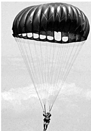
Parašutista při seskoku — ilustrační foto