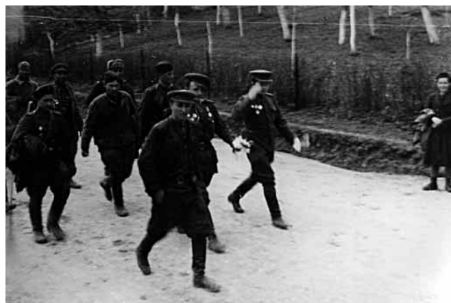
Metýlovští zdraví své osvoboditelé

Tatínek přivedl domů mladého ruského vojáka, který jezdil u Němců s koňmi a u Lhotky jim utekl. Dali jsme mu jíst a pak šel spát.“