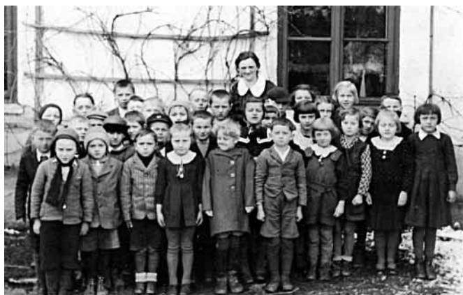
Děti z metulovské školy — 1940

Sběr se konal, ale sebraný materiál zůstal neodvezen.