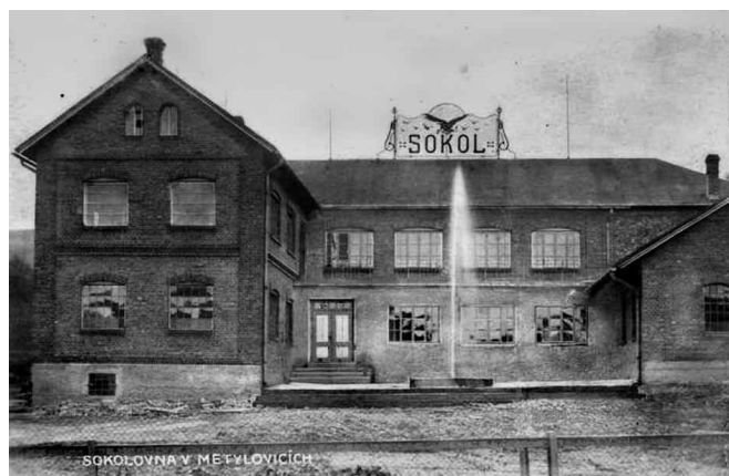
Sokolovna před válkou