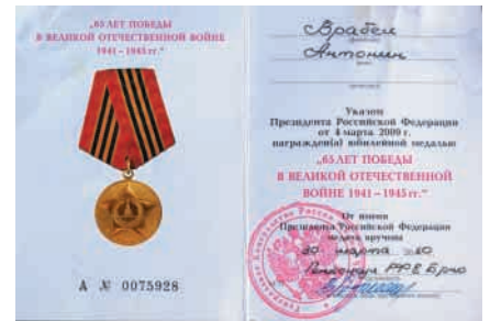
Pamětní list k vyznamenání pro Antonína Vrábela