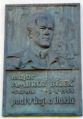
Pamětní deska majora Ambrože Bílka na škole, která nese jeho jméno