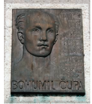
Pamětní deska Miloše Čupy na Sokolovně