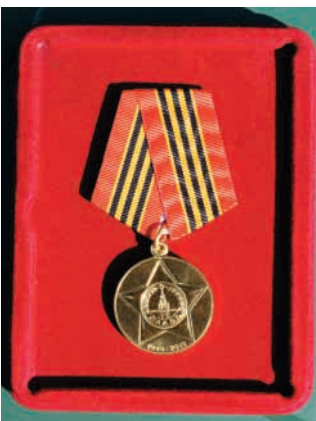
Pamětní medaile od ruského prezidenta

V měsíci květnu si připomeneme již 65. výročí osvobození České republiky od fašismu. Významný milník celosvětových dějin si v naší obci připomeneme ve středu 5. května v 17 hodin u památníku obětí 1. a 2. světové války u kostela v Metylovicích Zve starosta obce.