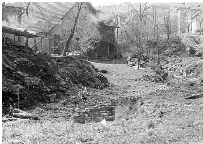
Zde projížděli vojáci, než se opravil most

Ráno jsme zaslechli, že byl vyhozen most na dolním konci. Kluci se tam hned běželi podívat. Za chvíli byli zpátky. Vypravovali, že k mostu přijel rudoarmějec na motorce. V 7 hodin byl vyvěšen ruský a český prapor na Čupku. V půl 8 již procházeli vesnicí první Rudoarmějci. Hlavní proud však šel na Lhotku. K večeru k nám přijeli Rusové s koňmi a povozy. Na druhý den v poledne odjeli za postupující frontou“.