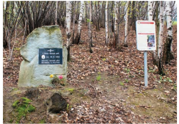
Památník amerického letce na úpatí Čupku