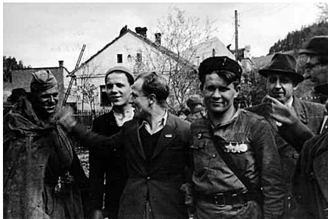
Metylovští vítali Rudou armádu s nadšením