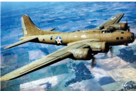
Americký letoun B-17 G, rozpětí 37 m, délka 25 m