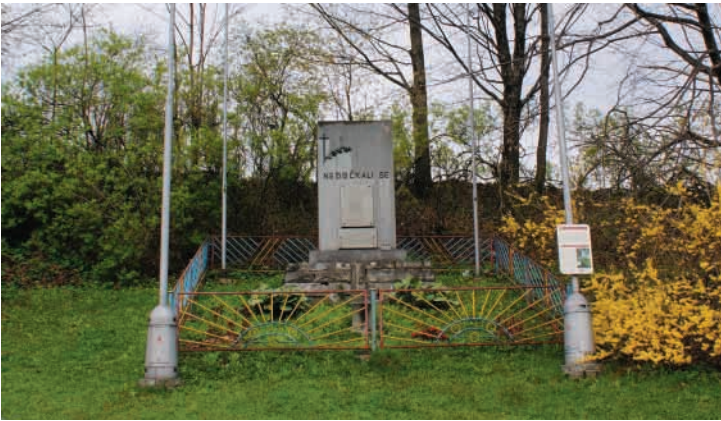
Pomník na Myslíku u místa, kde byli zavražděni i 2 občané z Metylovic