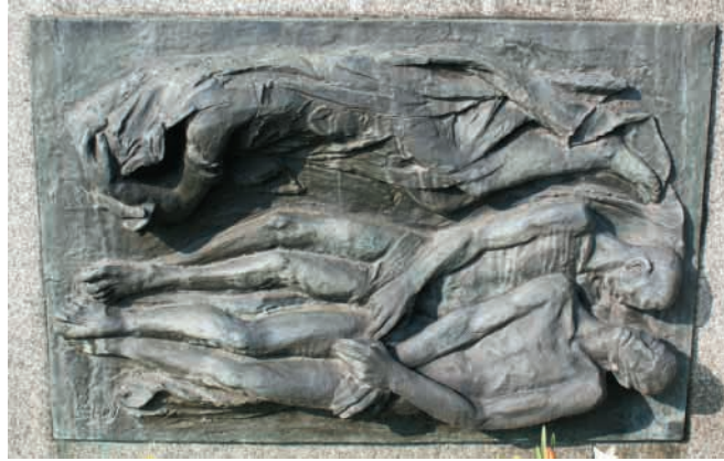
Pamětní deska bratrů Bílkových na hřbitově