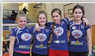
ÚSPĚCHY NAŠICH MALÝCH VOLEJBALISTEK