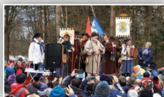
MONTE ČUPELO 2019