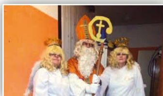
MIKULÁŠ U SENIORŮ