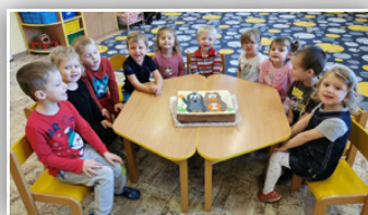
▶ MEGA DORT ◀ V MŠ