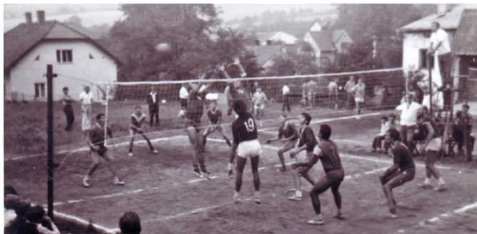
Memoriál v roce 1972, hráno na hřišti za školou