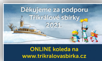
▶ LETOŠNÍ ◀ TŘÍKRÁLOVÁ SBÍRKA