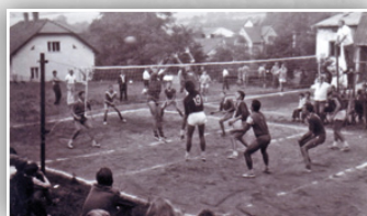
▶ Z HISTORIE ◀ VOLEJBALU