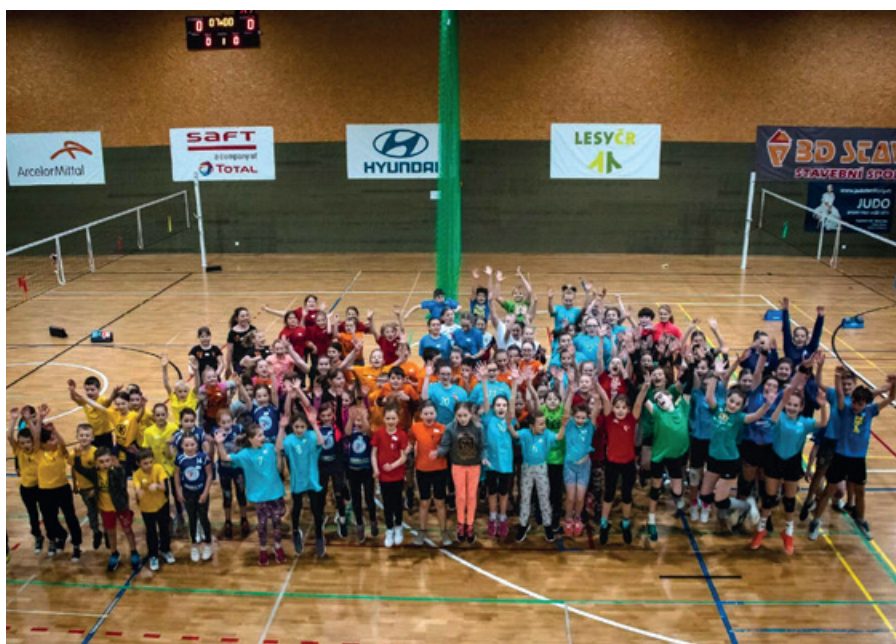
Turnaj v BMV v Raškovicích

Na volejbal se dorazilo podívat přibližně 60 diváků a atmosféra byla parádní. Po odehrání všech utkání bylo společné ukončení, kdy bylo vyhlášeno konečné pořadí družstev. Všechna družstva dostala účastnické listy a ti, kteří skončili na 1. - 3. místě dostali navíc medaile a věcné ceny.