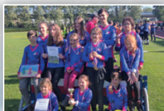
▶ ÚSPĚCH NAŠÍ HASIČSKÉ MLÁDEŽE ◀