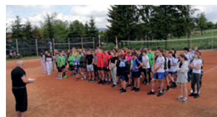
Závěrečný turnaj OP šestek na antukových kurtech v Metylovicích: závěrečný nástup