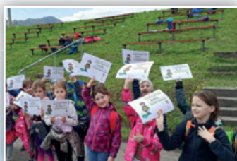
▶ Z ČINNOSTI MŠ A ZŠ METYLOVICE ◀