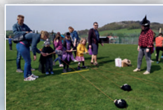
▶ PŘEDMÁJOVÉ POLÍBENÍ ◀