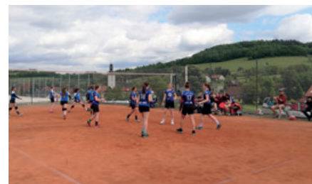
Závěrečný turnaj OP šestek na antukových kurtech v Metylovicích: družstvo Metylovic v popředí