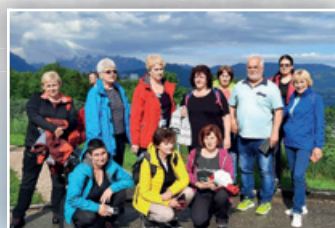
▶ ASPV – KDYŽ SE HOLKY VYDAJÍ DO SVĚTA ◀